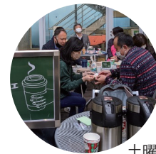
土曜カフェの様子