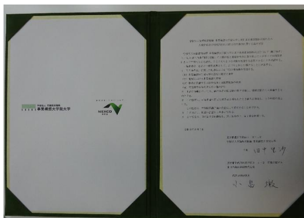
「人材育成と地域活性化に係る相互協力に関する基本協定」協定書