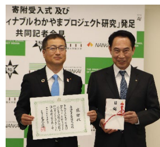
2023年10月23日 和歌山市役所にて実施した企業版ふるさと納税寄附受入式。 (左から)南海電気鉄道株式会社 社長 岡嶋信行、和歌山市長 尾花正啓

※企業版ふるさと納税(地方創生応援税制)とは、地方自治体による地方創生事業に対して、民間企業からの寄附を活用する制度です。