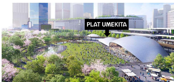
うめきた公園内「大屋根施設」

本施設はうめきた公園内「大屋根施設」の中心に位置する仕切りのないオープンスペースで、以下の3つのゾーンで構成されます。