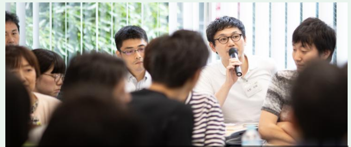
共同研究会への参加 年6回