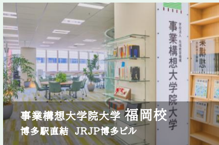
事業構想大学院大学 福岡校 博多駅直結 JRJP博多ビル