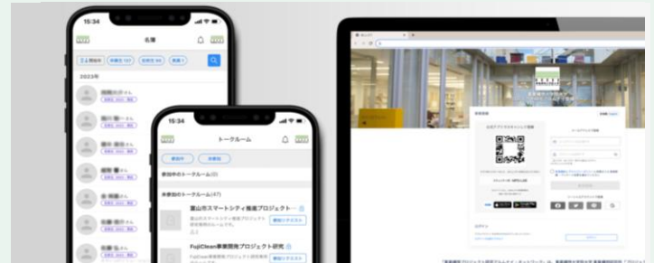
アルムナイネットワーク