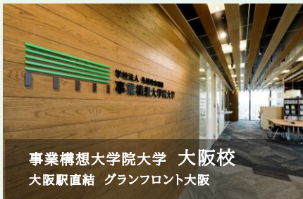
事業構想大学院大学 大阪校 大阪駅直結 グランフロント大阪