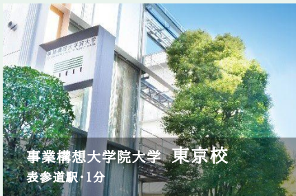
事業構想大学院大学 東京校 表参道駅・1分

理想の姿を描き、実現可能な計画に落とし込む事業構想について日本で唯一体系化したカリキュラムを保有する社会人向け大学院です。2012年の開学以来、6,000名近い事業構想人材を輩出してきました。顧客開発や経営・構想計画について学び、経営資源を活用した実現性と独自性の高い事業計画を構築します。