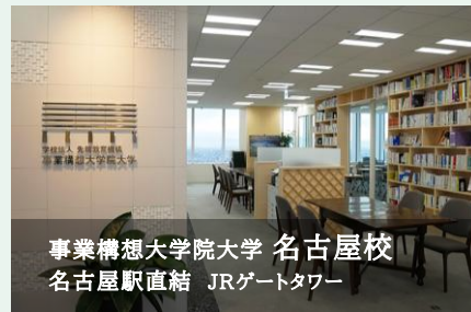
事業構想大学院大学 名古屋校 名古屋駅直結 JRゲートタワー