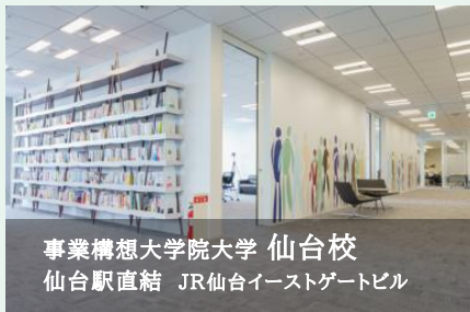
事業構想大学院大学 仙台校 仙台駅直結 JR仙台イーストゲートビル