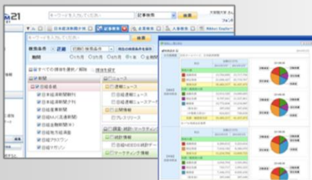
データベースの活用