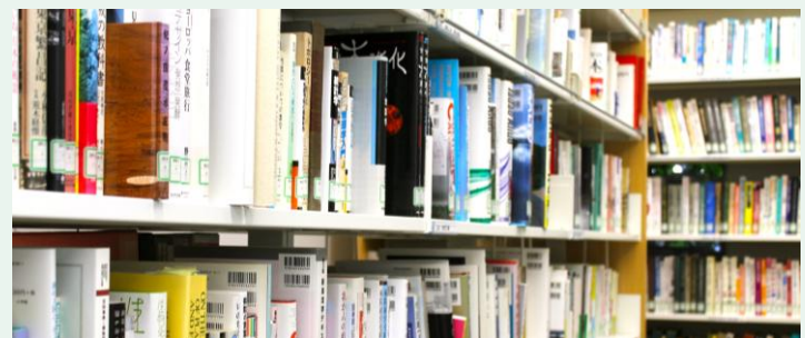
学内環境・サロンの活用