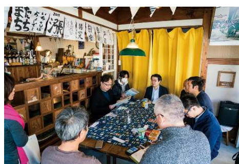
アートフェス構想や壱岐島の活性化策についての会議