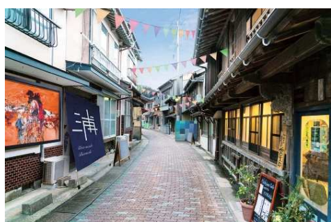
壱岐島アートフェス2019

事業構想大学院大学では平成30年度、内閣府知的財産戦略推進事務局より「クールジャパン地域プロデュース人材の効果的な育成に係る実証調査」の委託を請け、 クールジャパン活動を絡めた地域プロデュース人材育成に向けた教育プロジェクト を実施しました。具体的には長崎県の離島である壱岐市を対象地域として選び、そこでクールジャパンを構成するコンテンツのひとつである現代アートをテーマとした地域振興の可能性を探るとともに、最もクールジャパン活動に好意的といわれているタイを結ぶ活動展開を行いました。さらにこれらの実践を通じて、地域プロデュース人材の目指すべき人材像と、その育成手法について報告しました。