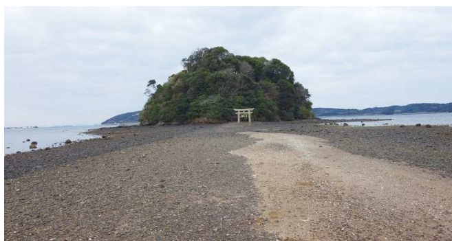
「日本のモンサンミッシェル」とも呼ばれる小島神社