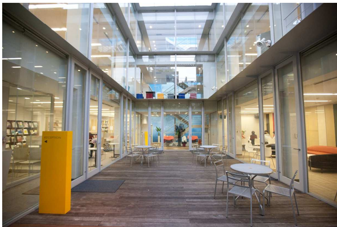
事業構想大学院大学（東京・南青山）